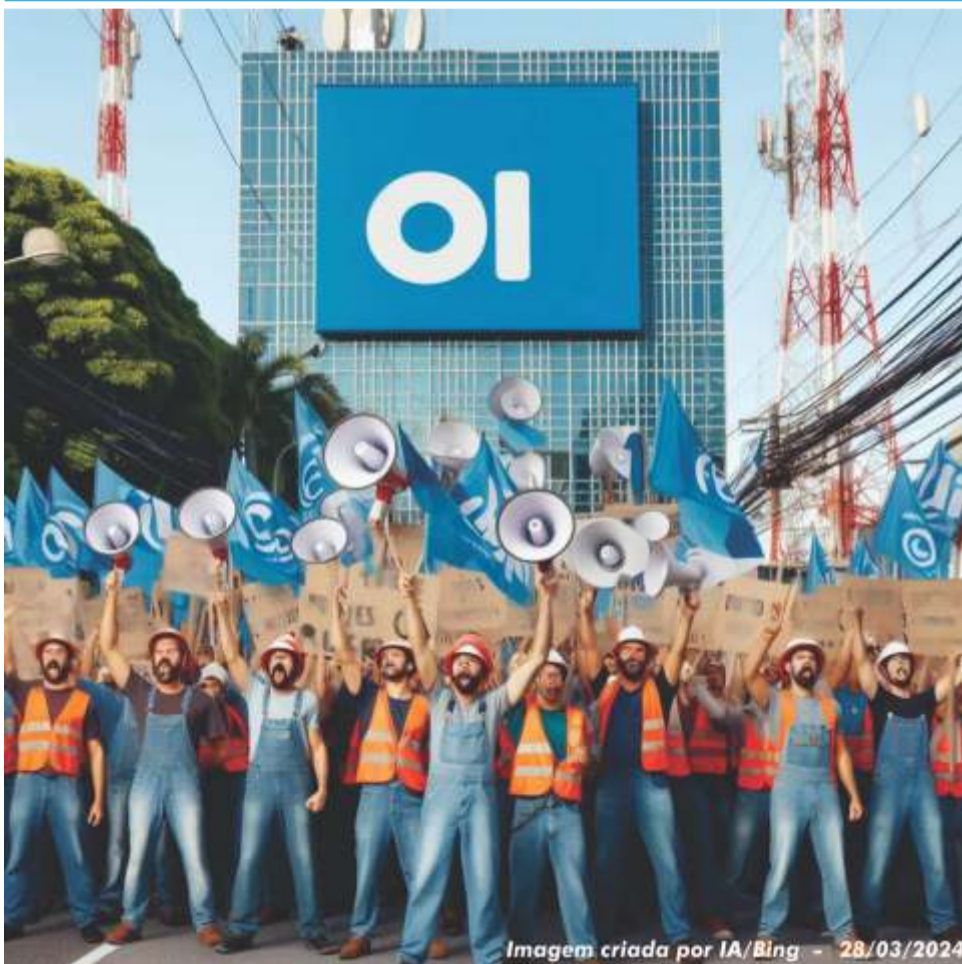
Imagem criada por IA/Bing - 28/03/2024