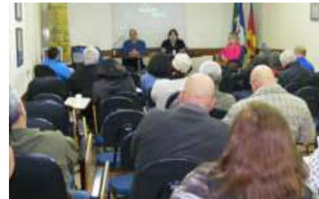
Entrega aos aposentados