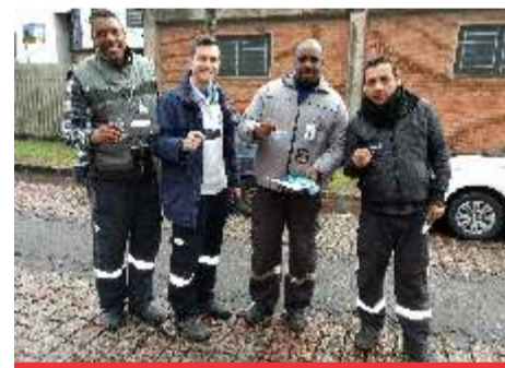
Entrega na CETP