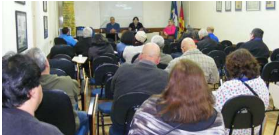
Entrega dos cartões de desconto aos aposentados já iniciou

mudanças das Reformas Trabalhista e da Previdência de Temer, seria muito bom se os Sindicatos estivessem enfraquecidos. E fica claro, também que para a Fundação Atlântico provocar futuros prejuízos a seus participantes nos próximos anos, é preciso enfraquecer e inviabilizar o SINTTEL e a AACRT, cortando suas fontes de recursos.