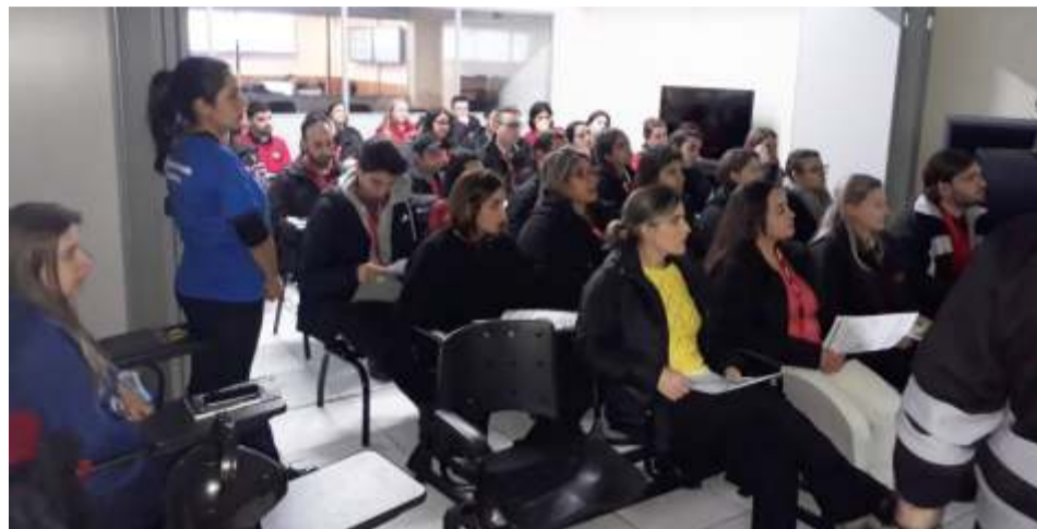
Assembleia trabalhadores da Bitcom dia 27/07

CONVÊNIOS - Durante as assembleias para debater o acordo coletivo, os