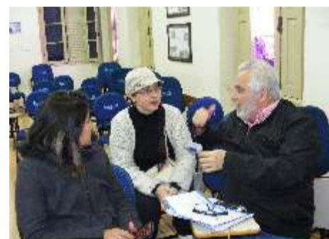
Entrega em POA