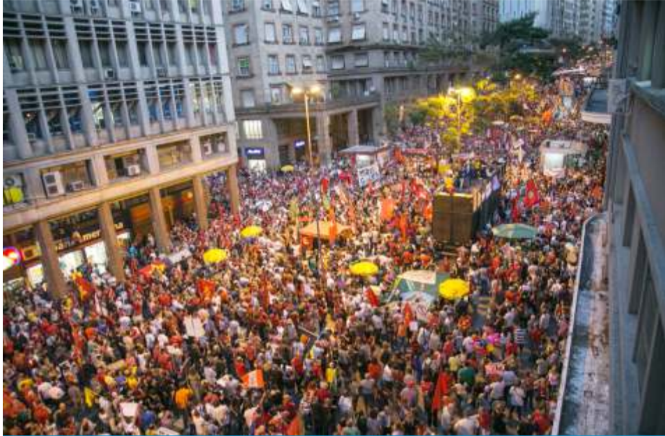
Ato contra reforma trabalhista na Esquina Democrática/POA

No próximo mês de outubro, os brasileiros irão às urnas escolher o presidente, os senadores e os deputados federais e estaduais. Neste momento, é fundamental analisar a trajetória dos candidatos, tanto os que concorrem à reeleição, como os que se apresentam como novos na política. É preciso olhar o seu passado e ver sua postura em frente aos grandes temas de interesse da população em geral, e dos trabalhadores em especial.