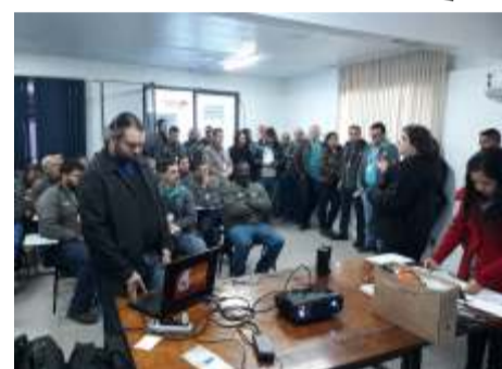
Entrega das carteirinhas em Santa Maria

O Instituto Avançar também oferece descontos especiais aos sindicalizados do SINTTEL-RS nos serviços e terapias de diversas áreas, com técnicas holísticas e complementares na área de saúde, que atendem na sede da entidade, tais como: Aulas de Biodanza e de Tai Chi Chuan e atendimento em Quiropaxia, Acunpuntura, Biomagnetismo, Massoterapia e Reflexologia, Terapeuta Holística, Constelação Familiar e Auriculoterapia. SÓCIOS DO SINTTEL TEM DESCONTOS ESPECIAIS EM CONSULTA COM TERAPEUTAS ALTERNATIVOS