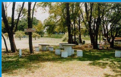
Sede campestre do Beco do Cego, no Lami