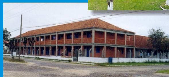
Colônia de Férias de Rondinha